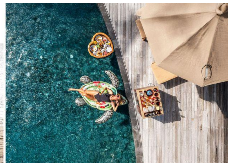
Siyam World Maldives als eines der besten Hotels der Welt ausgezeichnet.

Insgesamt konnte Siyam World fünf Spitzenplatzierungen erreichen: