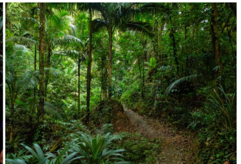
v.l.n.r.: Argyle Wasserfall im Main Ridge Rainforest; Lokaler Guide auf einer Tour durch den Main Ridge; Main Ridge Rainforest Trail