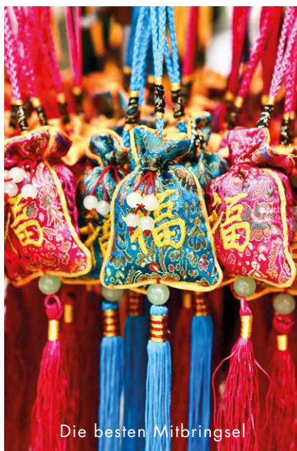
Die besten Mitbringsel