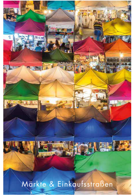
Märkte & Einkaufsstraßen