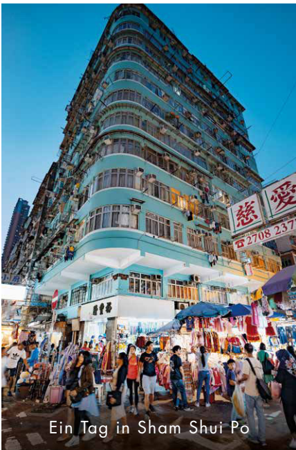
Ein Tag in Sham Shui Po