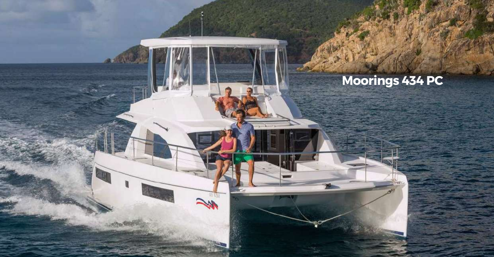
Moorings 434 PC