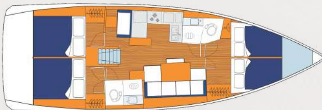
Monohull / Einrumpf-Segelyacht