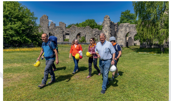
Auf der Festung Rothenberg

Der Samstagvormittag führt nach Hersbruck und damit in die Stadt, die als erste in Deutschland 2001 in die „Internationale Vereinigung der lebenswerten Städte – cittaslow“ aufgenommen wurde. Warum, klärt sich bei einer kulinarischen Stadtführung mit diversen Verkostungsstationen.