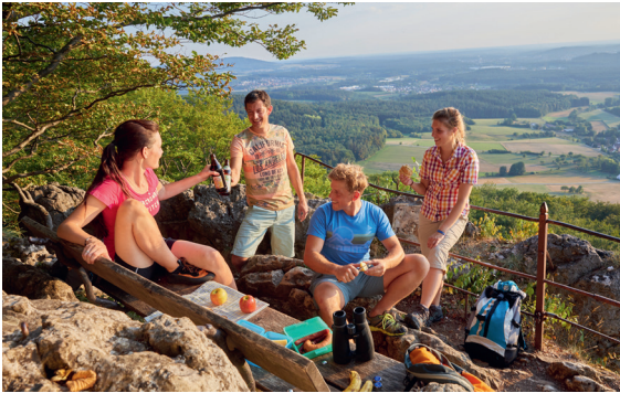
Auf dem Glatzenstein

Das Nürnberger Land und der Frankenwald stehen bei dieser Gruppenpressereise vom 9. bis zum 11. Mai 2025 für eine spannende Recherche-Mischung. Es geht beim „Geburtstagswandern“ auf dem „Frankenweg“ hoch hinauf und entlang des „Grünen Bands“ in die deutsch-deutsche Geschichte. Gleichzeitig führt die Reise in die Bierkultur und an den Tisch der Sterneküche.